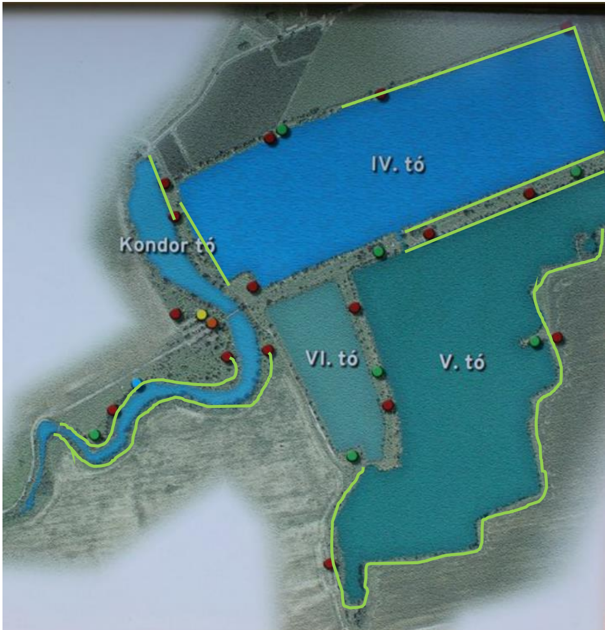
1. ábra - Sátorozásra engedélyezett partszakaszok